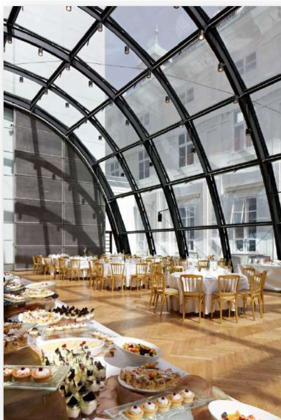
HOFBURG GALERIE